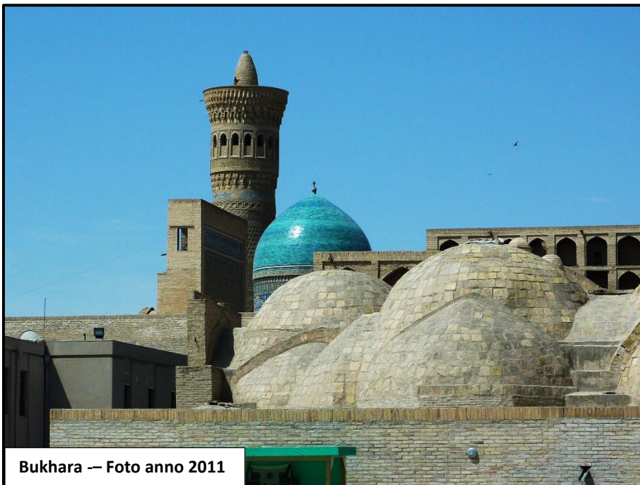
Bukhara -- Foto anno 2011

Bukhara, soprannominata “la sacra”, “la nobile” , forse è meno presente nell'immaginario comune occidentale rispetto a Samarcanda.