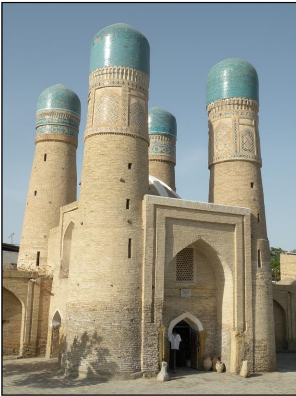
SO Bukhara -Chor Minor – Foto anno 2011 pernottamento