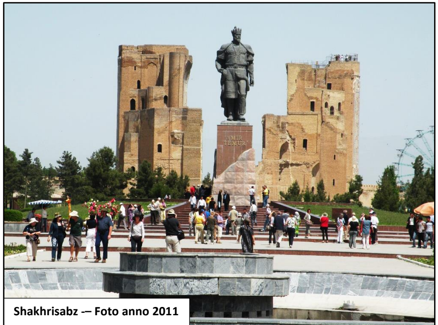
Shakhrisabz — Foto anno 2011

Originariamente conosciuta come Kesh, Shakhrisabz fu ribattezzata dallo stesso Tamerlano col nome con cui oggi tutti la conosciamo e che, letteralmente, significa " città verde ", chiaro riferimento ai giardini rigogliosi che l'hanno sempre contraddistinta.