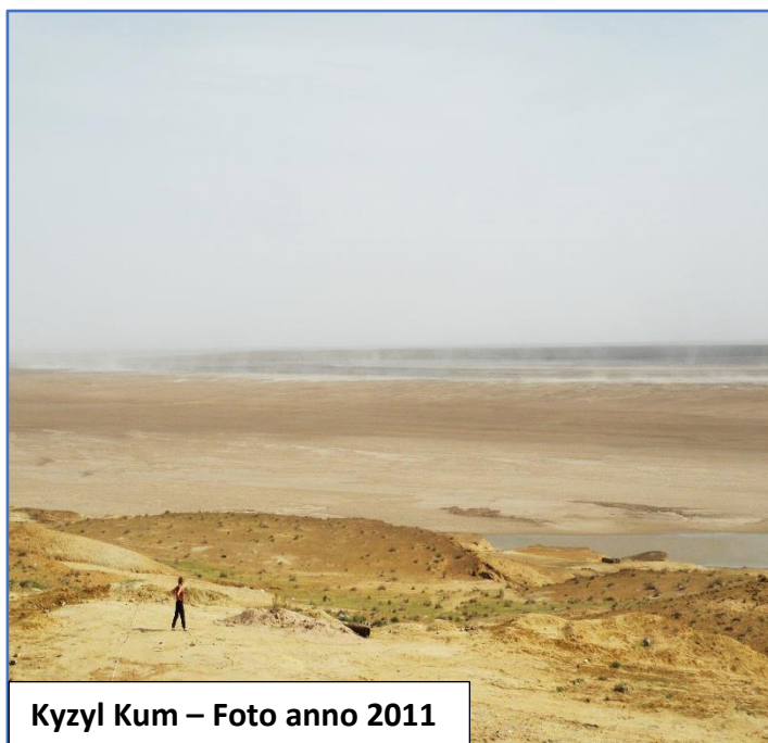
Kyzyl Kum – Foto anno 2011

Al termine delle visite, trasferimento in hotel, sistemazione nelle camere riservate, cena e pernottamento.