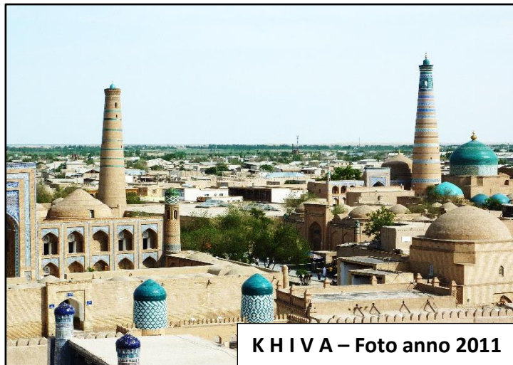
K H I V A – Foto anno 2011

Degne di nota sono la moschea Juma , edificato sopra l'antico luogo di culto del VIII/XI secolo, il cui interno è sorretto da una serie di colonne in legno, e la madrassa Islam Kohja . Pranzo in ristorante in corso di visite.