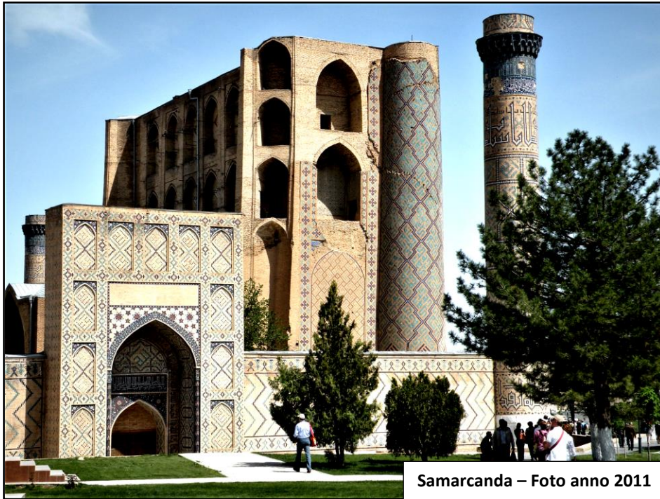
Samarcanda – Foto anno 2011

Nei secoli successivi fino al 13° la città passò da un impero all'altro: dai Turchi gli Arabi, dai Persiani sassanidi ai Turchi karakhanidi e selgiuchidi, dai Mongoli karakitay agli scià della Corasmia. Sotto l' Impero Sasanide di Persia, Samarcanda rifiorì e diventò una delle città maggiori dell'Impero, con una popolazione che toccò un milione di abitanti , ben tre volte di più degli attuali 350 mila.