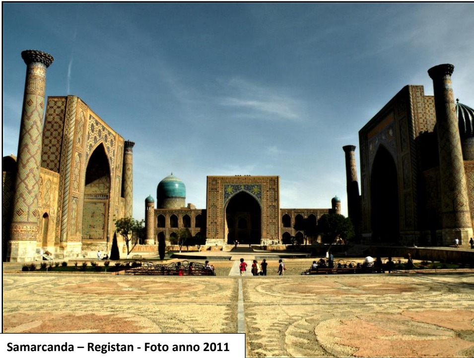
Samarcanda – Registan - Foto anno 2011