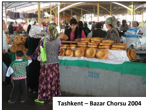
Tashkent – Bazar Chorsu 2004

Antico ma ancora attuale cuore commerciale della città il Chorsu bazar uno dei più bei mercati alimentari di tutta l'Asia Centrale . Aperto sin dalle prime luci dell'alba, mette in mostra le prelibatezze del territorio senza troppi fronzoli, in un ambiente coloratissimo, frenetico e straordinario. È qui, sotto le volte arcuate di una grande yurta, che scorre la vita più autentica e dove potrete entrare in contatto non solo con gli usi degli uzbeki di Tashkent, ma con un'intero Paese, un'intera umanità. Al termine, sistemazione in hotel. Cena e pernottamento.